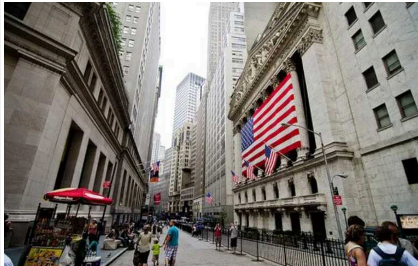
Волл-стріт вкладає більше коштів у кампанію Гейлі на тлі побоювань, що Трамп повернеться

Мільярдер та керівники компаній з Волл-стріт фінансують кампанію Ніккі Гейлі на першинних президентських виборах республіканців на тлі тривоги щодо перспективи повернення Дональда Трампа в Білий дім.