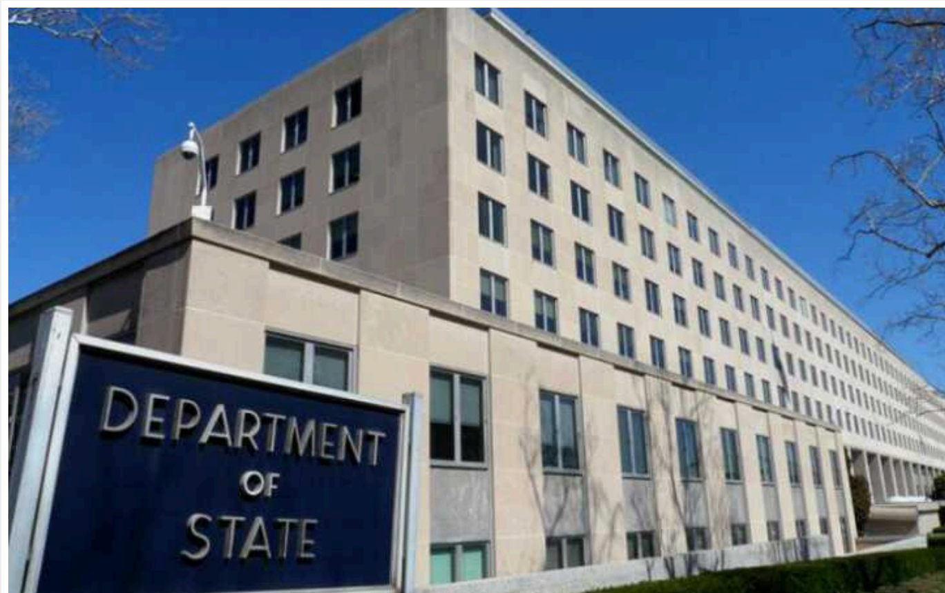
Держдеп США озвучив стратегію перемоги України у війні з РФ

Україна у 2024 році стане сильнішою і матиме кращі позиції для перемоги у війні з Росією завдяки допомозі Сполучених Штатів та Європейського Союзу.