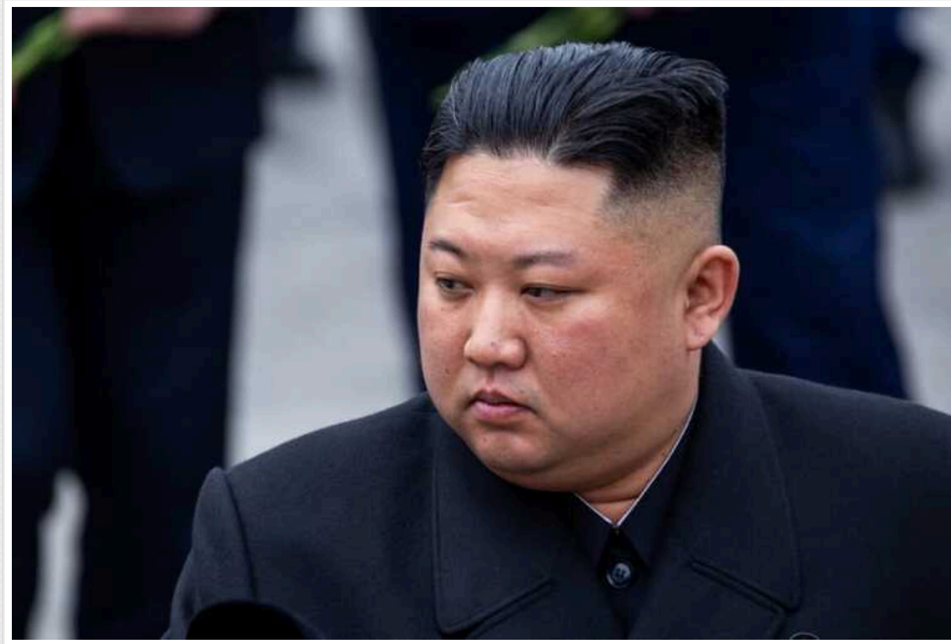
Bloomberg: Кім Чен Ин готовий розпочати війну, але його стримує вигідніший сценарій

Останніми тижнями лідер КНДР Кім Чен Ин зробив низку заяв, що свідчать про його бажання і готовність розпочати війну з Півднем. Однак у Пхеньяна є вагома причина не розпалювати конфлікт, адже темпи зростання економіки Північної Кореї сягнули найвищого рівня за майже десятиліття через продаж озброєнь Росії.