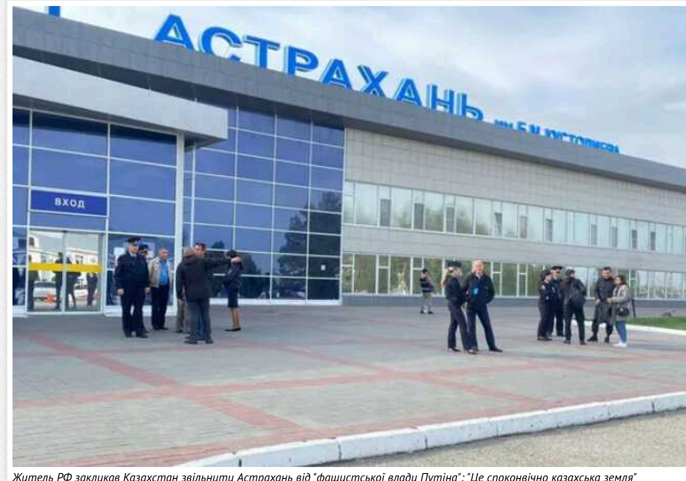
Житель РФ закликав Казахстан звільнити Астрахань від "фашистської влади Путіна": "Це споконвічно казахська земля"

Проти юного жителя Астраханського краю в РФ порушили кримінальну справу щодо заклику до тероризму. Приводом стало відео, опубліковане у власному каналі молодика.