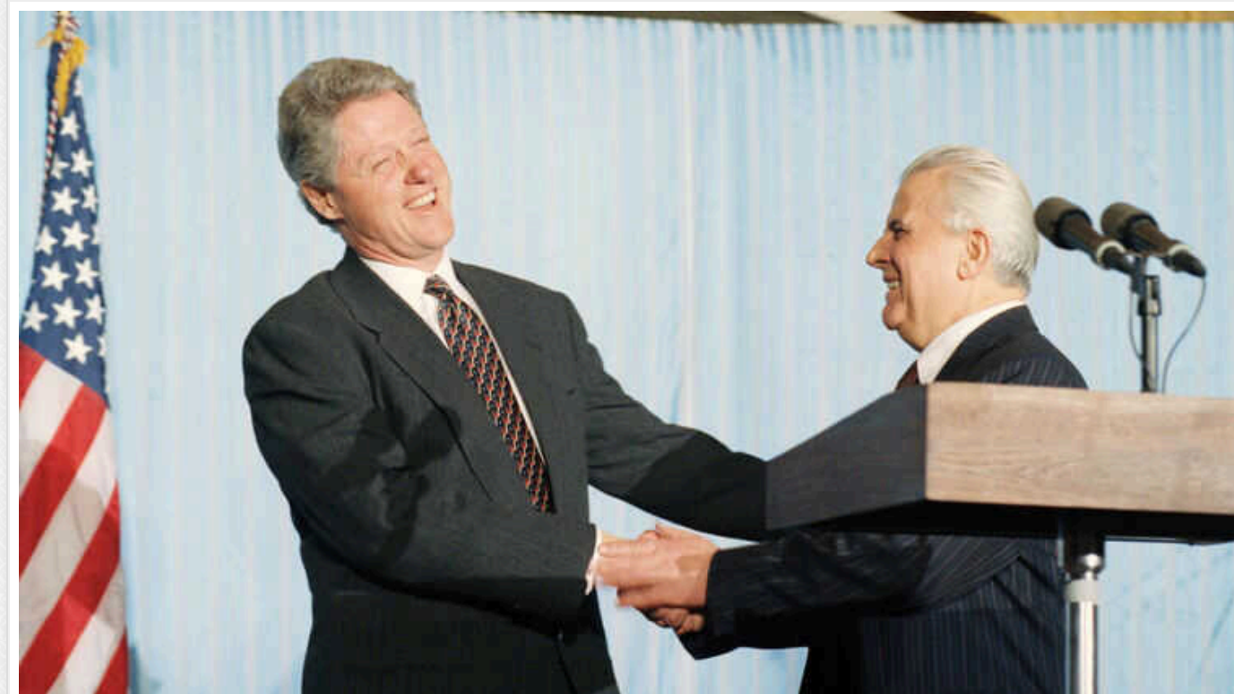
Кравчук у 1994 році скаржився Клінтону на націоналістів, які виступають проти ядерного роззброєння

У 1994 році Президент України Леонід Кравчук скаржився американському президенту Біллу Клінтону на націоналістів, які виступають проти ядерного роззброєння.