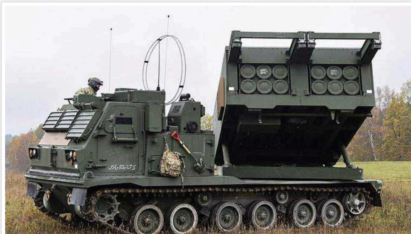
Франція надала Україні ще дві системи РСЗВ LRU

Міністерство оборони Франції передало Україні додатково ще дві реактивні системи залпового вогню LRU.