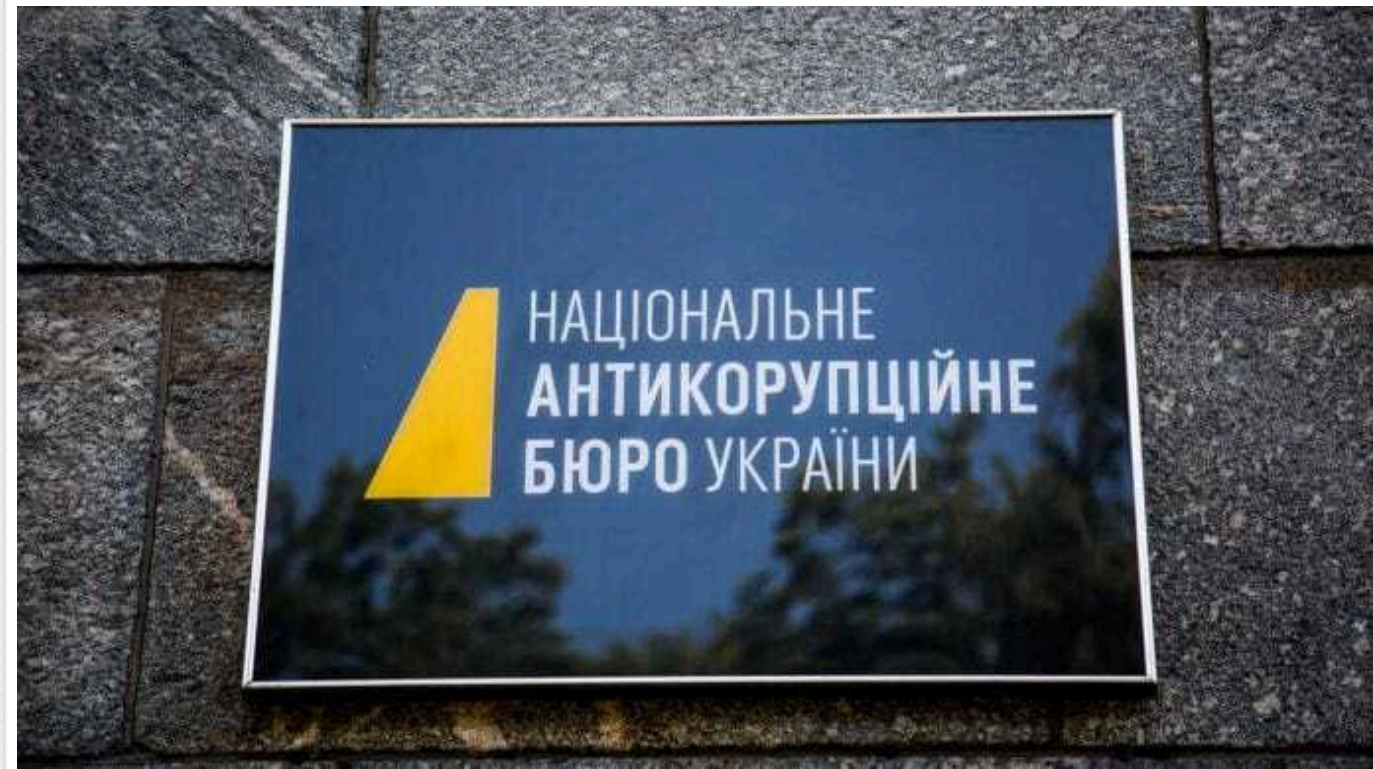
ЦПК подав заяву до Офісу Генпрокурора про розпил мільярда на шпиталі для військових – справу скерували до НАБУ

ГО «Центр Протидії Корупції» подала заяву до офісу Генерального прокурора стосовно закупівель ремонтних робіт у Київському міському клінічному шпиталі ветеранів війни, – виявили завищені ціни на будматеріали. У січні заяву було скеровано до НАБУ.