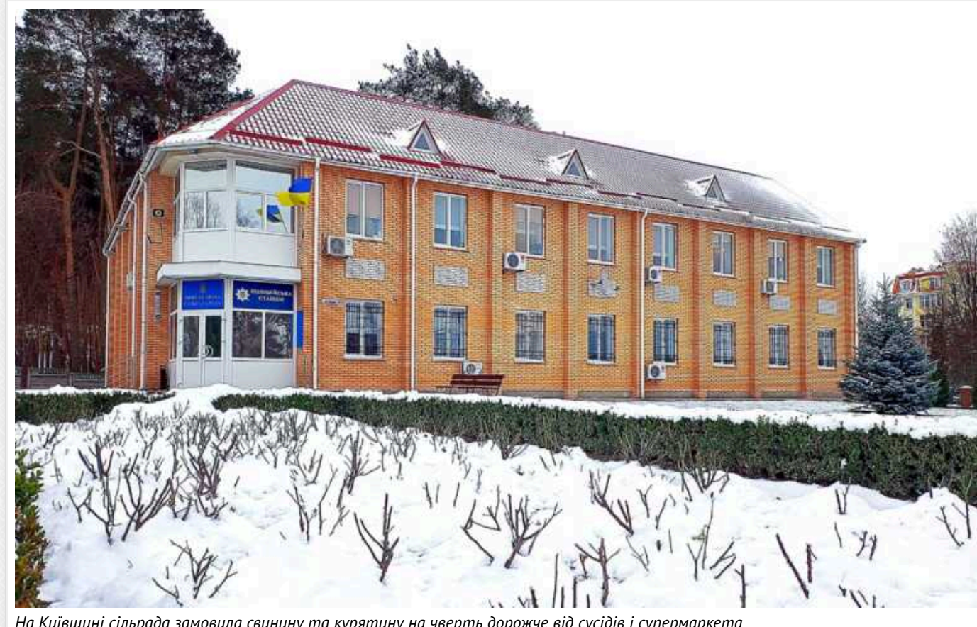
На Київщині сільрада замовила свинину та курятину на чверть дорожче від сусідів і супермаркета

Управління гуманітарного розвитку та охорони здоров'я Пристоличної сільської ради Київської області 16 січня за результатами тендеру уклало угоду з ТОВ «Фудгранд» про постачання м'яса вартістю 2,59 млн грн.