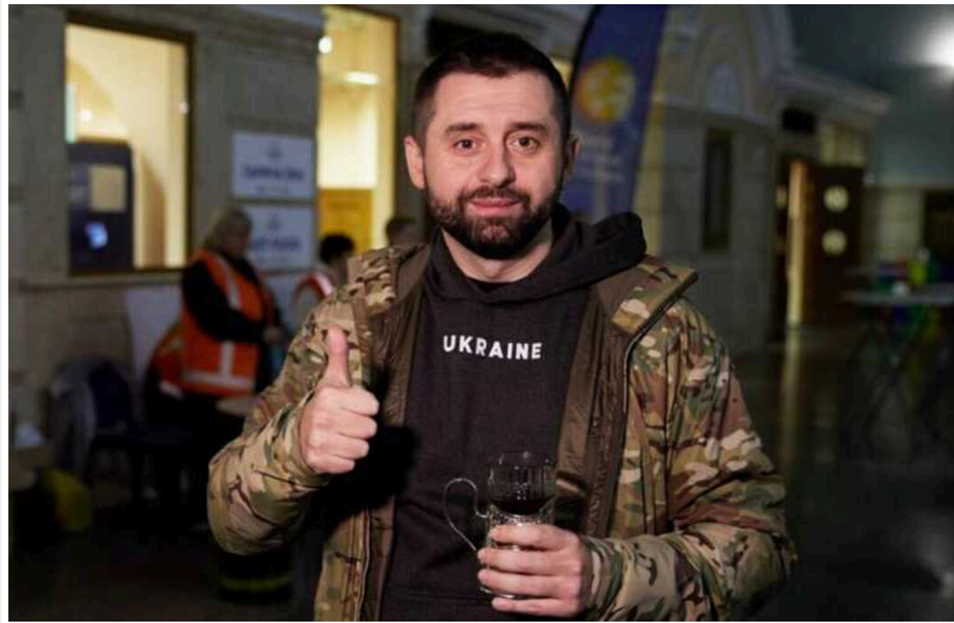
Нардеп запропонував влаштувати військові навчання для всіх депутатів та держслужбовців

Глава парламентської фракції «Слуга Народу» Давид Арахамія запропонував влаштувати військові навчання для всіх державних службовців та народних депутатів. На його думку, це може мотивувати українців «не боятися мобілізації та проходити навчання».