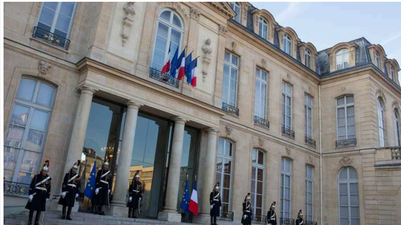
В Міноборони Франції відреагували на російські фейки про загибель у Харкові "французьких найманців"

Міністерство оборони Франції після публікації російських фейків про нібито загибель "французьких найманців" внаслідок удару по Харкову заявило, що йдеться про скоординовану дезінформацію.