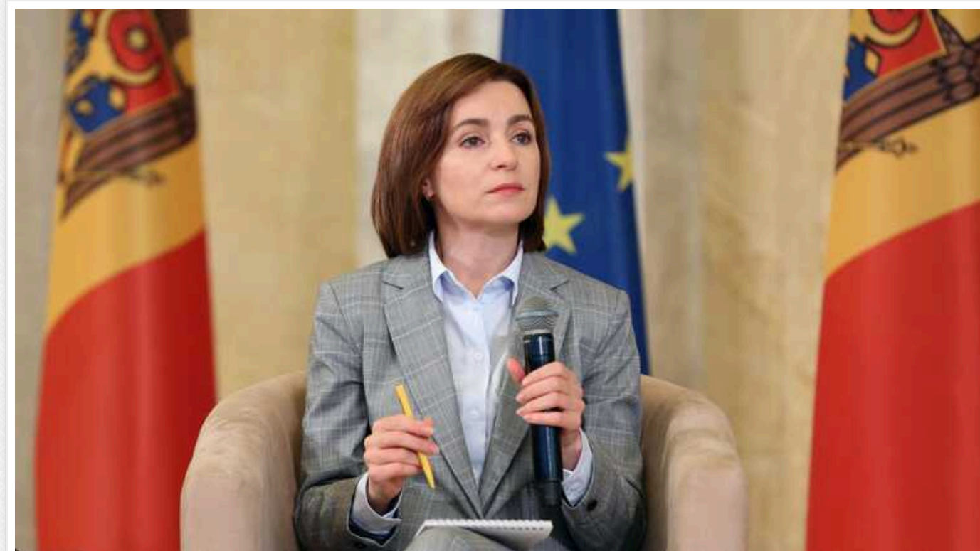
Президентка Молдови почала консультації про майбутній референдум щодо вступу країни у ЄС

Президентка Молдови Мая Санду почала консультації з експертною спільнотою щодо організації майбутнього референдуму про вступ країни у ЄС.