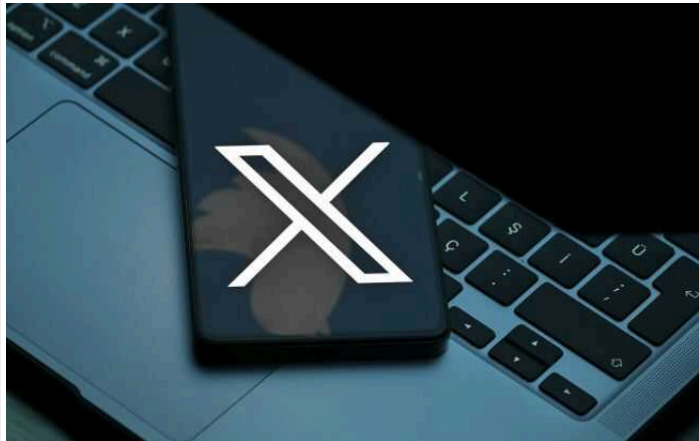
ЗМІ: В МЗС Німеччини стурбовані масштабною російською дезінформацією у Twitter (X)

Фахівці при Міністерстві закордонних справ Німеччини виявили системну кампанію дезінформації, яка ведеться на користь Росії у соцмережі Twitter (X), і в уряді стурбовані, що у перспективі можливе втручання у вибори.