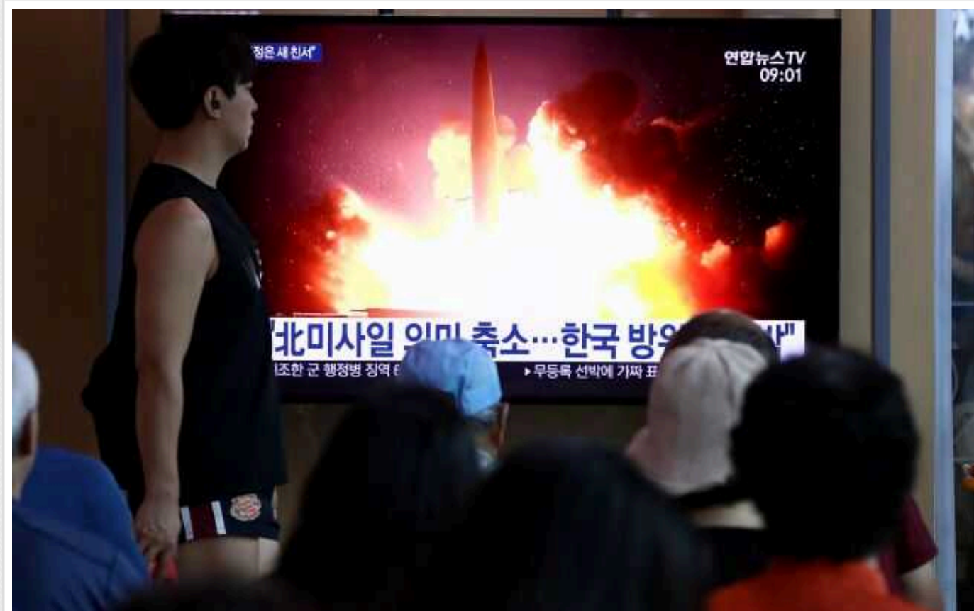
У США припустили ймовірність конфлікту між Південною Кореєю і КНДР у найближчі місяці, – NYT

У США припустили ймовірність того, що КНДР невдовзі може застосувати військові дії проти Південної Кореї. Це відбувається на тлі відкритої ворожої політики північнокорейського лідера Кім Чен Инна до південних сусідів.