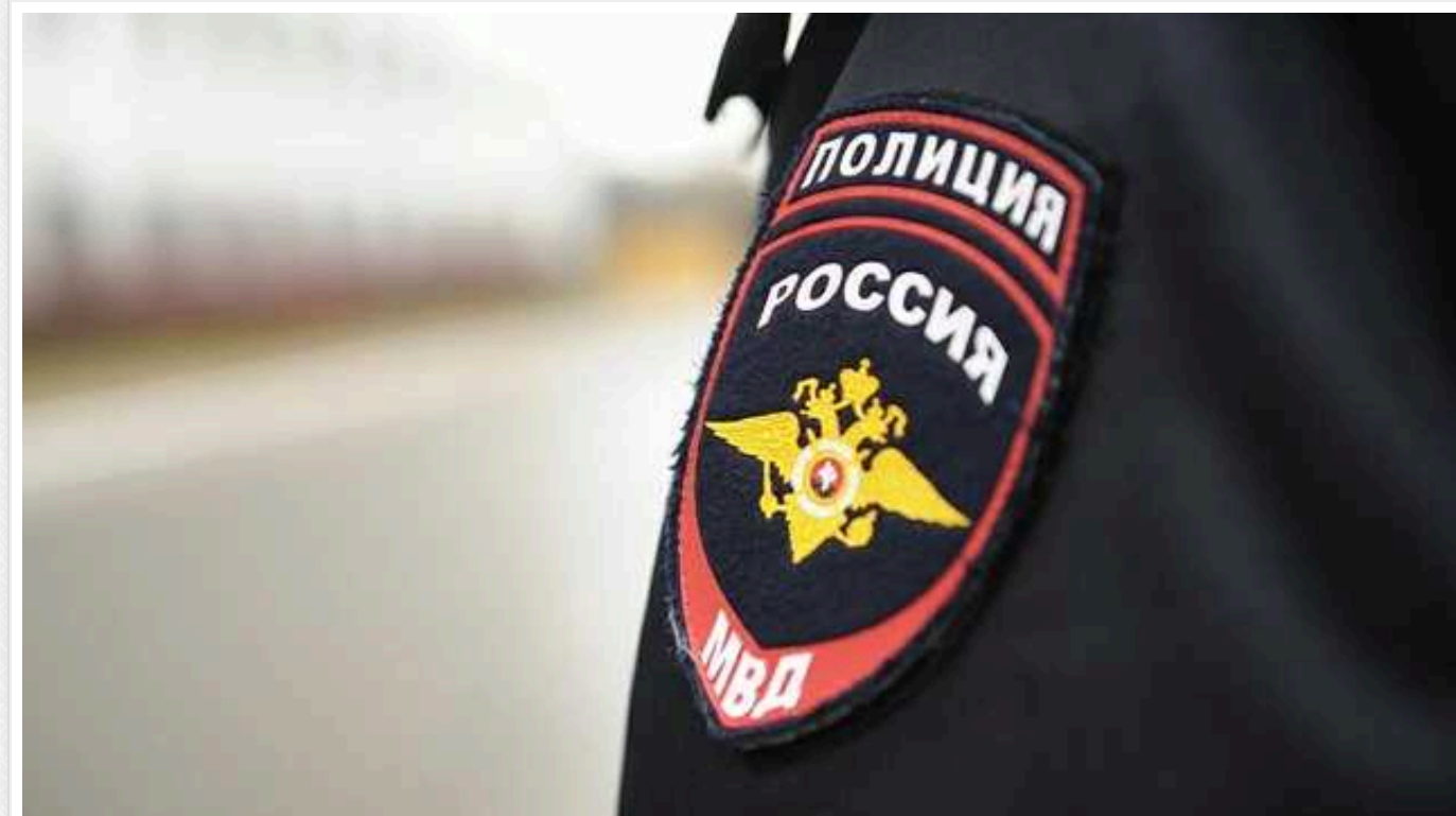
Житель РФ закликав Казахстан звільнити Астрахань від "фашистської влади Путіна": "Це споконвічно казахська земля"

Проти юного жителя Астраханського краю в РФ порушили кримінальну справу щодо закликів до тероризму. Приводом стало відео, опубліковане у власному каналі молодика.