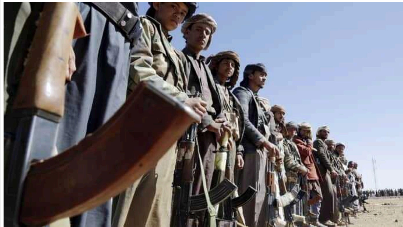
Reuters: Китай закликав Іран стримати напади хуситів у Червоному морі

Китайські офіційні особи нібито звернулися до Ірану із закликами стримати напади еменських хуситів на кораблі у Червоному морі. У Китаї заявили, що інакше Тегеран ризикує завдати шкоди діловим відносинам із Пекіном.