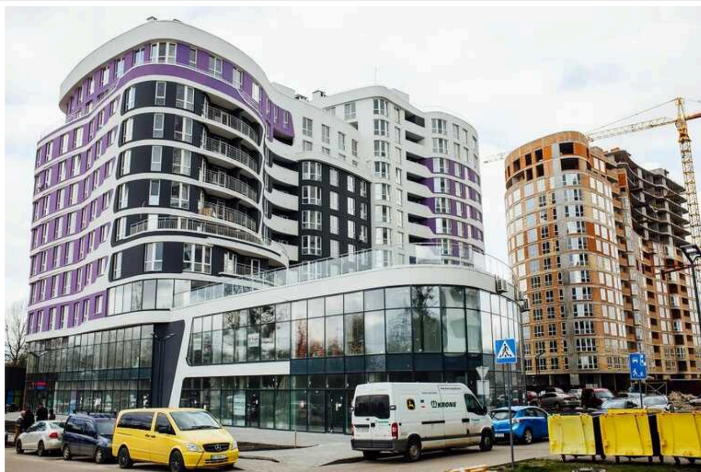
Львівська міськрада відсудила в забудовника майже півмільйона гривень: орендар землі під ЖК «Парус Smart» упродовж 2023 року не сплачував за користування ділянкою

Господарський суд Львівської області зобов'язав ТзОВ «Укр-Євро-Сервіс» виплатити Львівській міській раді майже 440 тис. грн боргу за оренду землі під ЖК «Парус Smart». Підприємці просили розділити виплату боргу на кілька платежів, однак суд постановив внести один платіж.