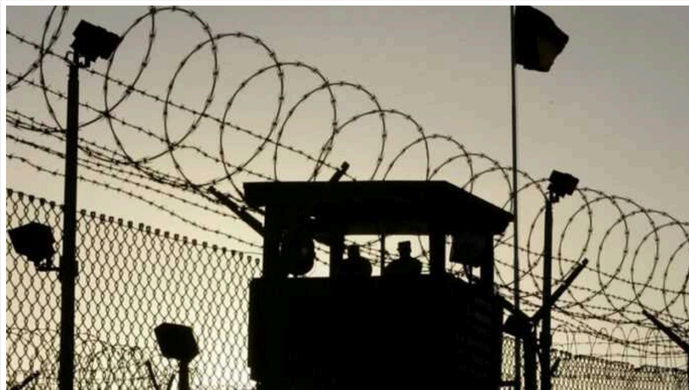
У Штатах вперше стратили в'язня за допомогою чистого азоту

У четвер, 25 січня, у штаті Алабама, США, вперше стратили засудженого за допомогою газоподібного азоту. Штат просуває цей метод як простішу альтернативу смертельним ін'єкціям.