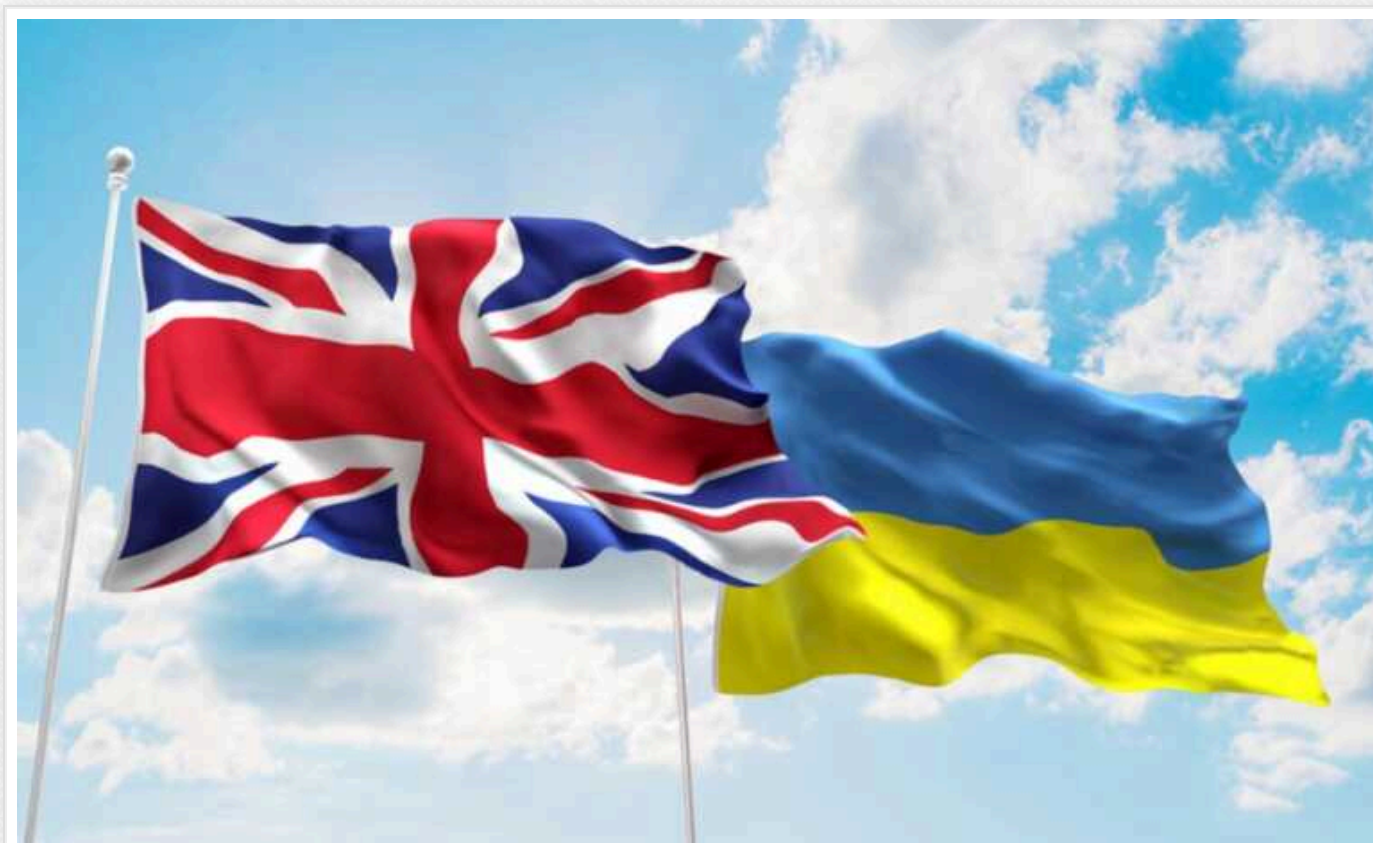
Велика Британія закликала подвоїти допомогу Україні

Велика Британія закликає партнерів подвоїти підтримку України для того, щоб вона не лише перемогла у війні, яку проти неї розв'язала Росія, але й вийшла з неї сильною та суверенною державою.