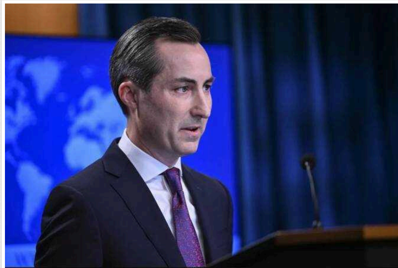
Сполучені Штати готові посилювати санкції проти режиму Лукашенка в Білорусі

У США мають намір посилювати санкції, а також вживати інших заходів проти режиму Олександра Лукашенка в Білорусі.