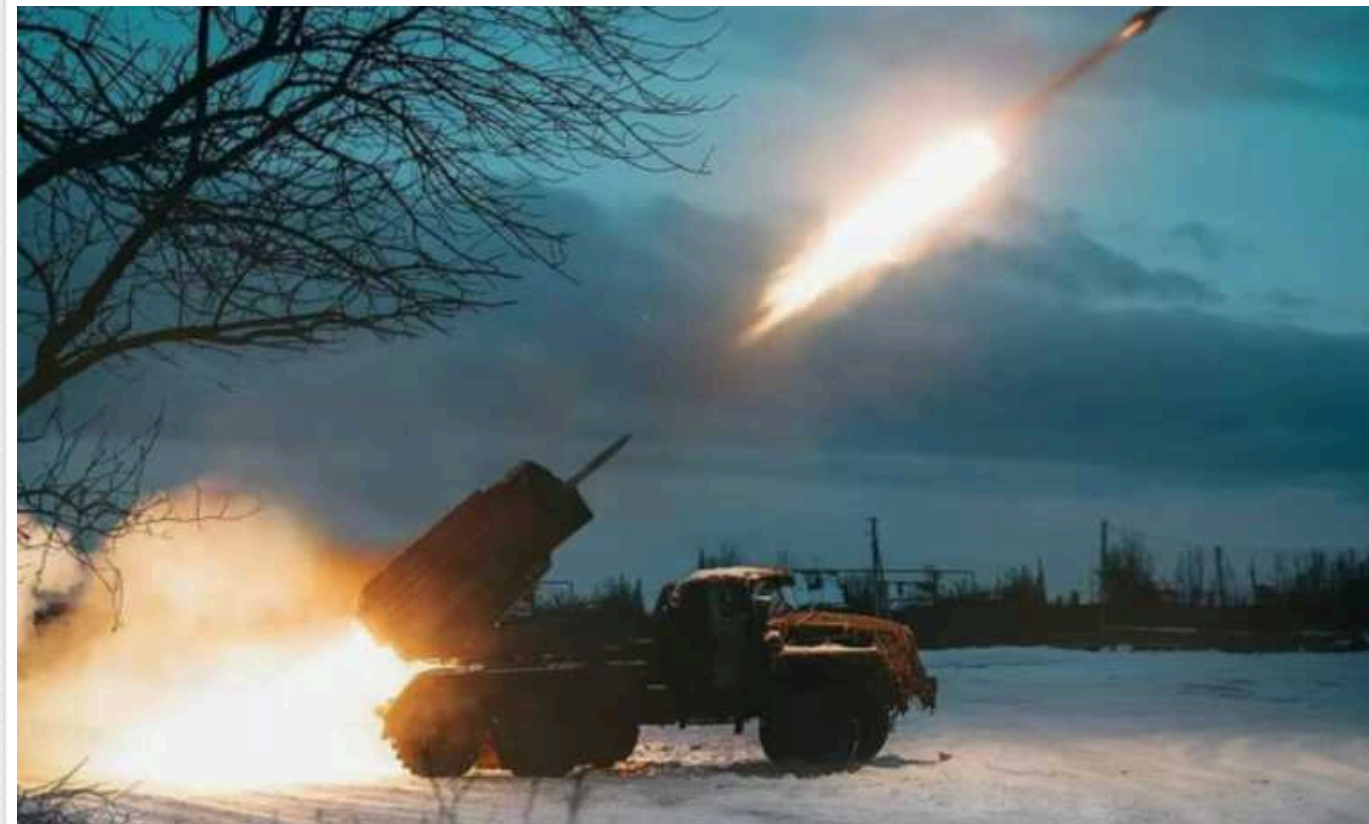
Втрати ворога: Сили оборони знищили 990 окупантів, 16 ББМ та 15 артсистем ворога

Росія продовжує зазнавати втрат у загарбницькій війні проти України – лише за минулу добу Сили оборони знищили 990 окупантів, 16 ББМ та 15 артилерійських систем росіян.