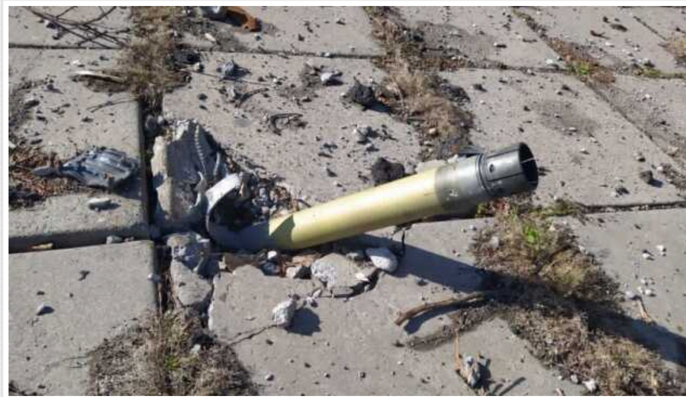
Окупанти за добу випустили по Херсонщині 350 снарядів, загинув цивільний

Минулої доби російські загарбники здійснили 73 обстріли Херсонської області, загинула одна людина.