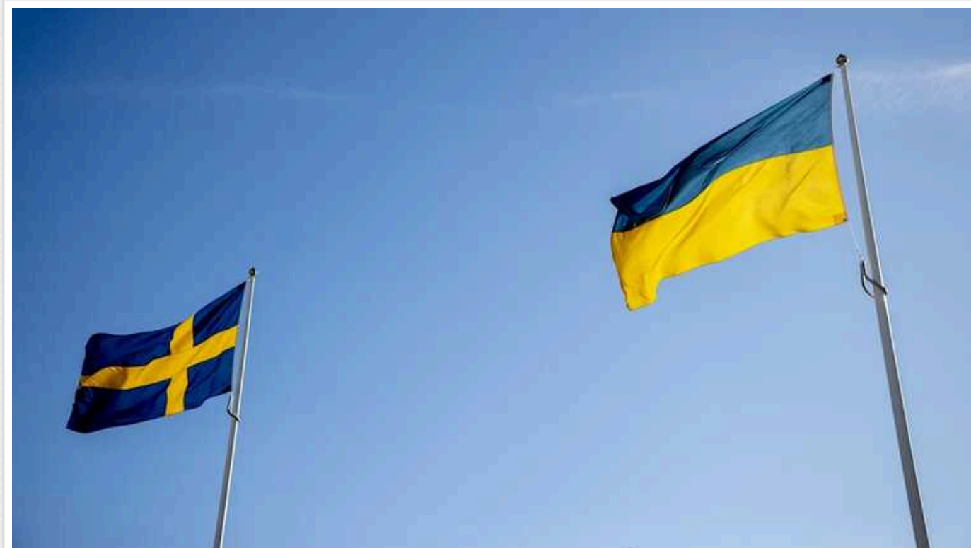
Швеція за період війни надала українському енергосектору понад тисячу тонн вантажів допомоги

З початку повномасштабного вторгнення РФ Швеція надала 93 гуманітарні вантажі загальною вагою 1108 тонн допомоги енергетичному сектору України.