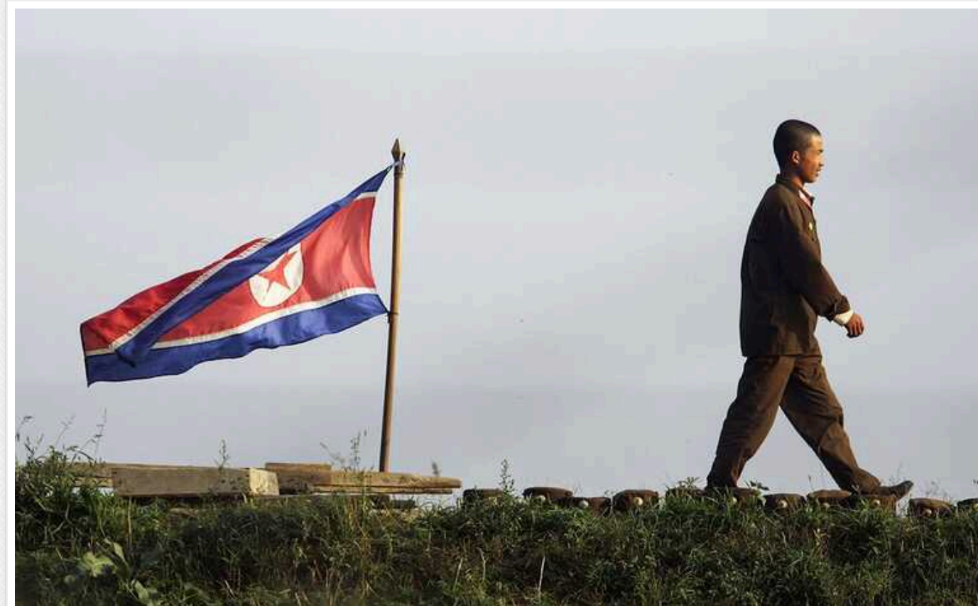
США непокояться через можливу "смертоносну акцію" з боку КНДР, – NYT

У США непокояться через те, що північнокорейський лідер Кім Чен Ин у найближчі місяці може здійснити якусь "смертоносну акцію" проти Південної Кореї.