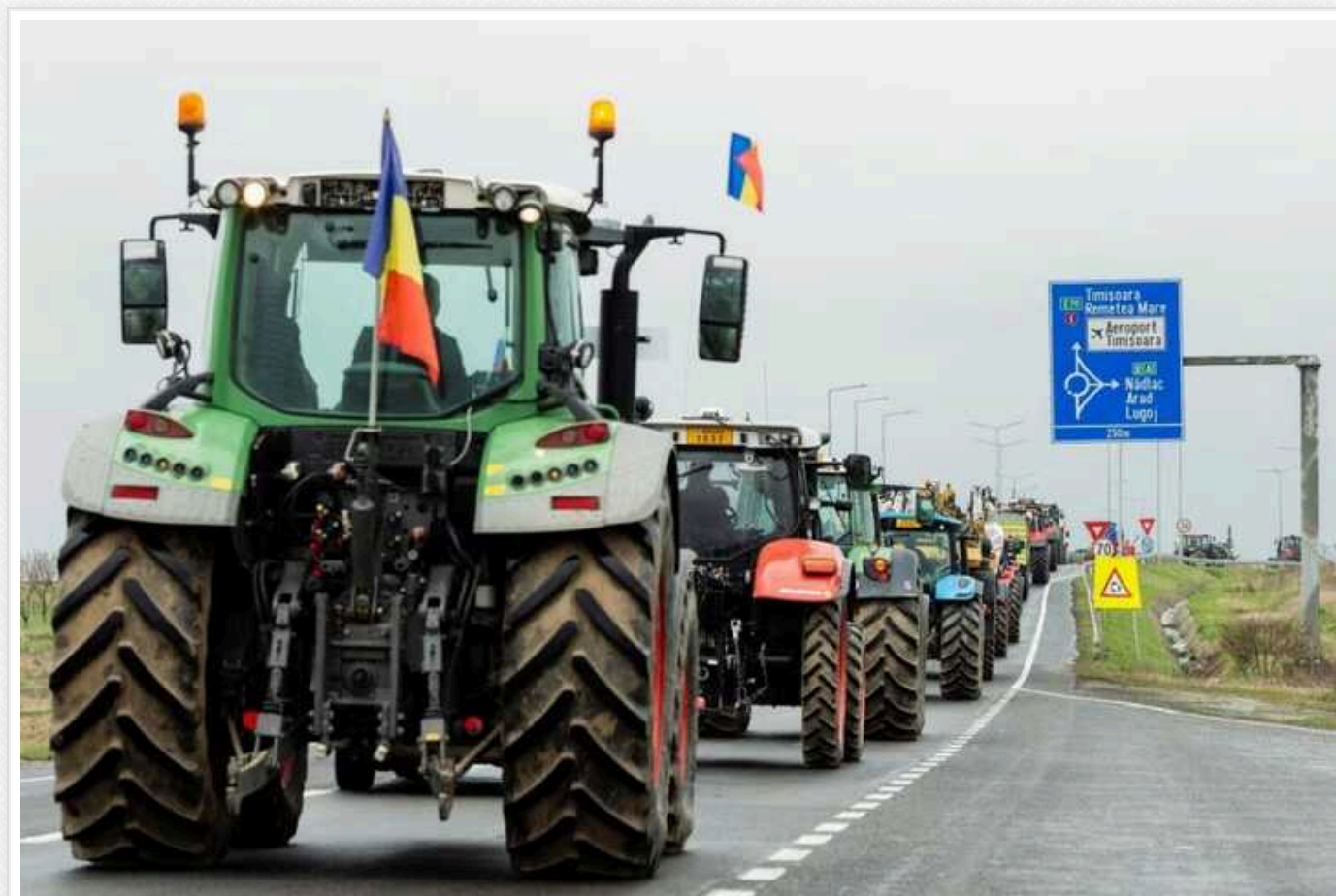
У Румунії уряд погодив заходи підтримки фермерів, які скаржились на імпорту з України

Румунський уряд 25 січня схвалив три рішення про додаткову допомогу фермерам, які раніше блокували пункти пропуску на кордоні з Україною, вимагаючи субсидій і захисту від впливу українського імпорту.