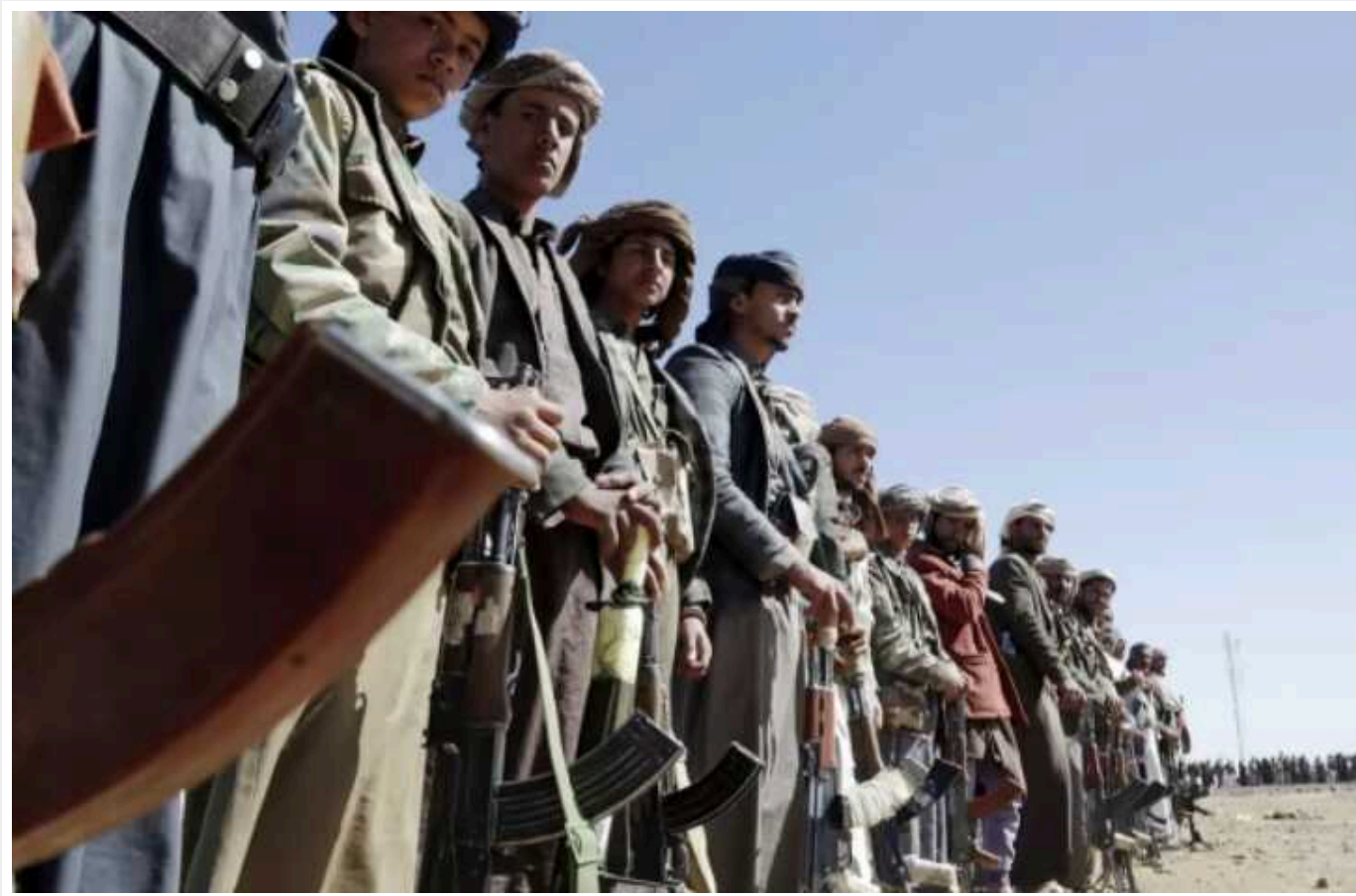
Китай попросив Іран стримати напади хуситів, – Reuters

Китайські чиновники попросили своїх іранських колег допомогти стримати напади на кораблі в Червоному морі з боку підтримуваних Іраном хуситів.