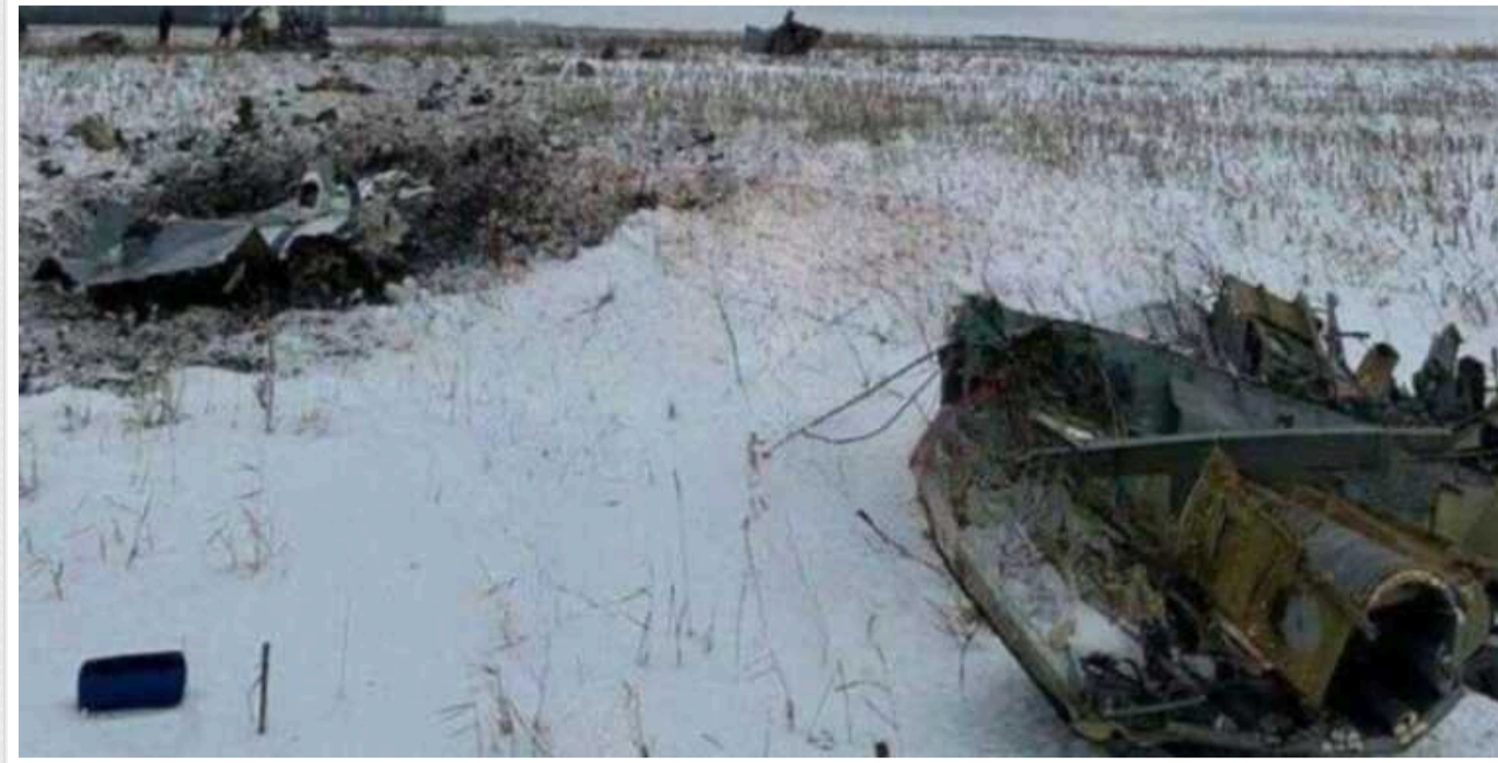
Данілов заявив про відповідальність РФ за збиття літака Іл-76: "Постійно брешуть"

За словами секретаря РНБО Олексія Данілова, в Україні опублікують пояснення щодо ситуації з Іл-76 лише тоді, коли валідують інформацію.