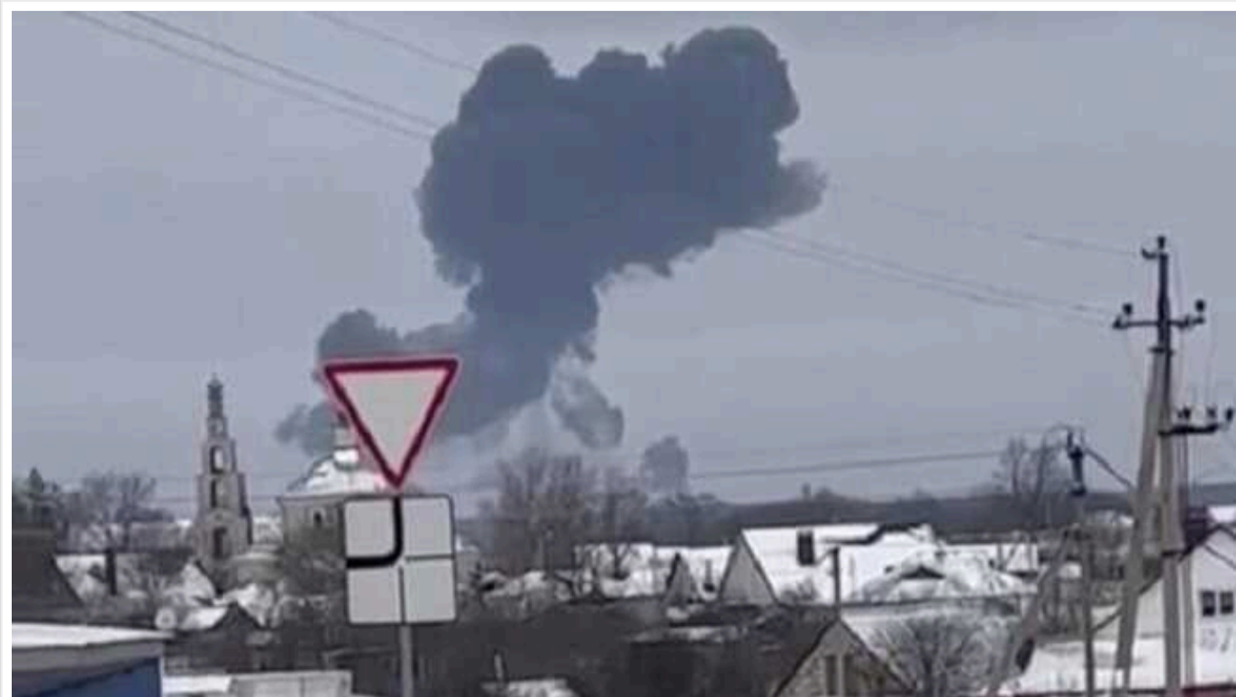
Гур про падіння літака Іл-76: Три людини охороняли 65 полонених — звучить дивно