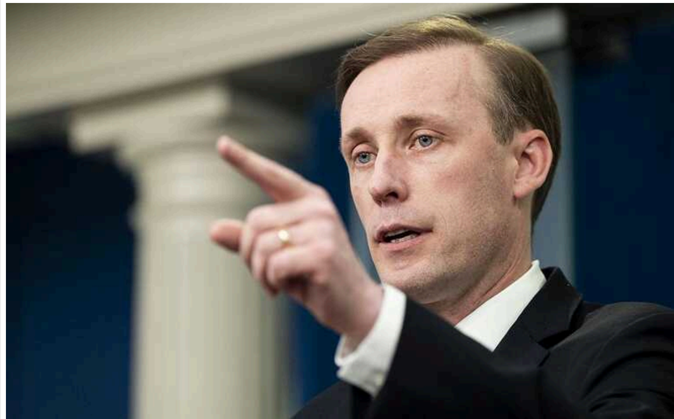
FT: Салліван і глава МЗС Китаю найближчими днями проведуть переговори в закритому режимі

Найближчими днями радник з національної безпеки США Джейк Салліван проведе приватну зустріч з міністром закордонних справ Китаю Ван І. Дипломати відновлять спілкування "внутрішнім каналом", який відіграє вирішальну роль у стабілізації відносин.