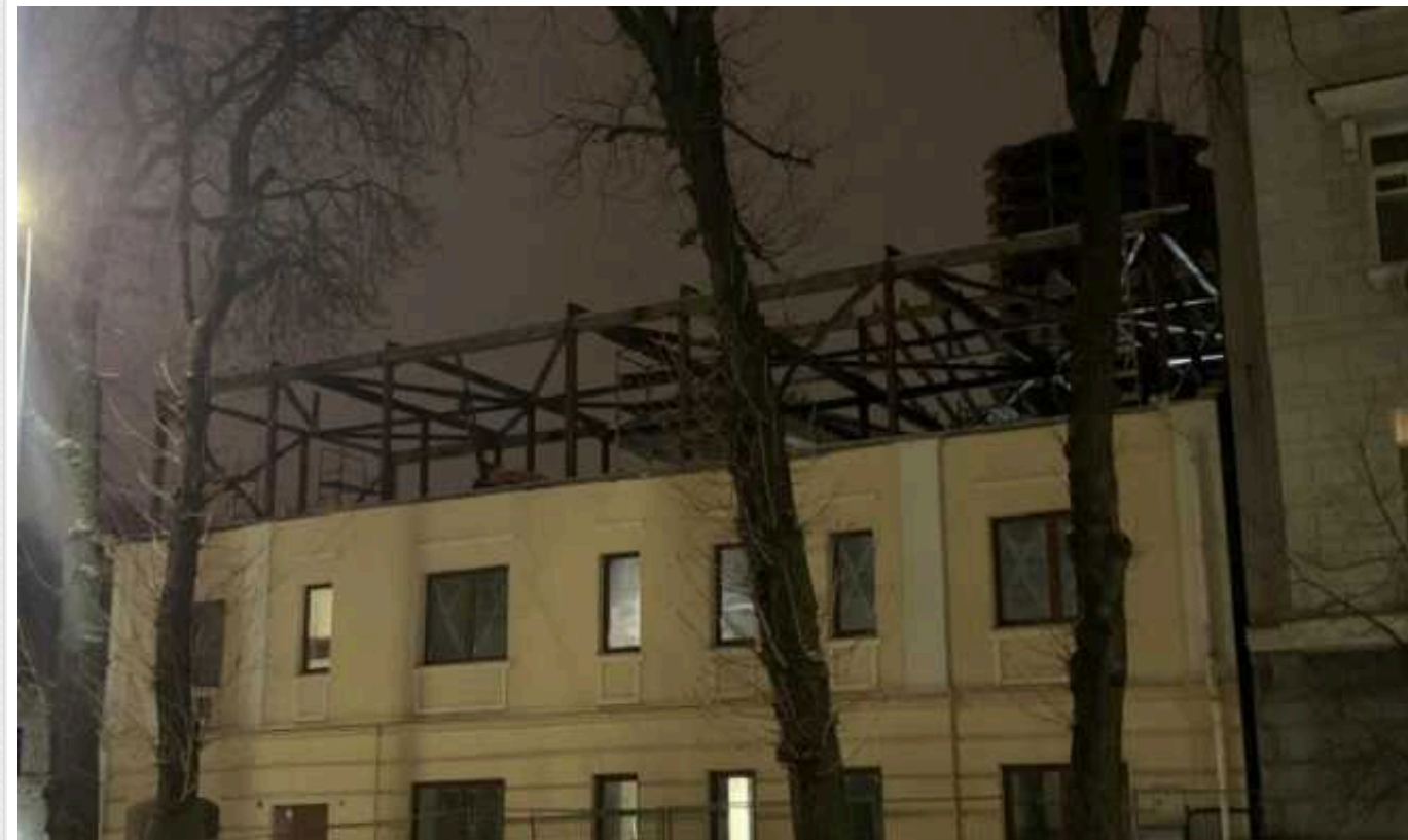
Самовільна надбудова Будинку Замкова продовжується, попри відкрите кримінальне провадження

У Києві будівельники продовжують зводити надбудову історичної пам'ятки – Будинку Замкова. Роботи виконуються попри відкрите кримінальне провадження. Ані столична влада, ані Міністерство культури та навіть Нацполіція не можуть завадити знищенню пам'ятки.