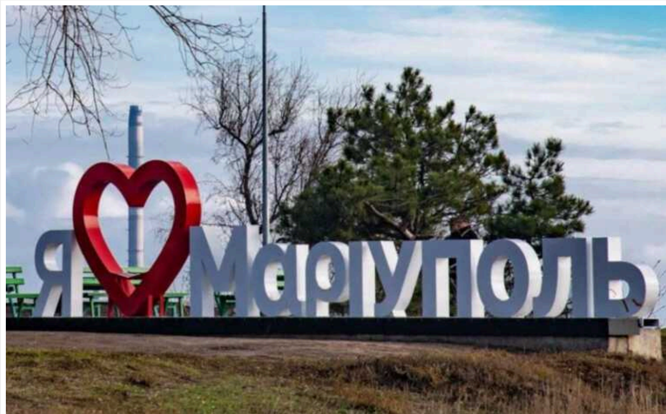
В окупованому Маріуполі розпочалися нові перевірки житла

В окупованому Маріуполі квартирами ходять представники так званої "адміністрації" міста, які перевіряють документи на квартири та наявність у місті власника.