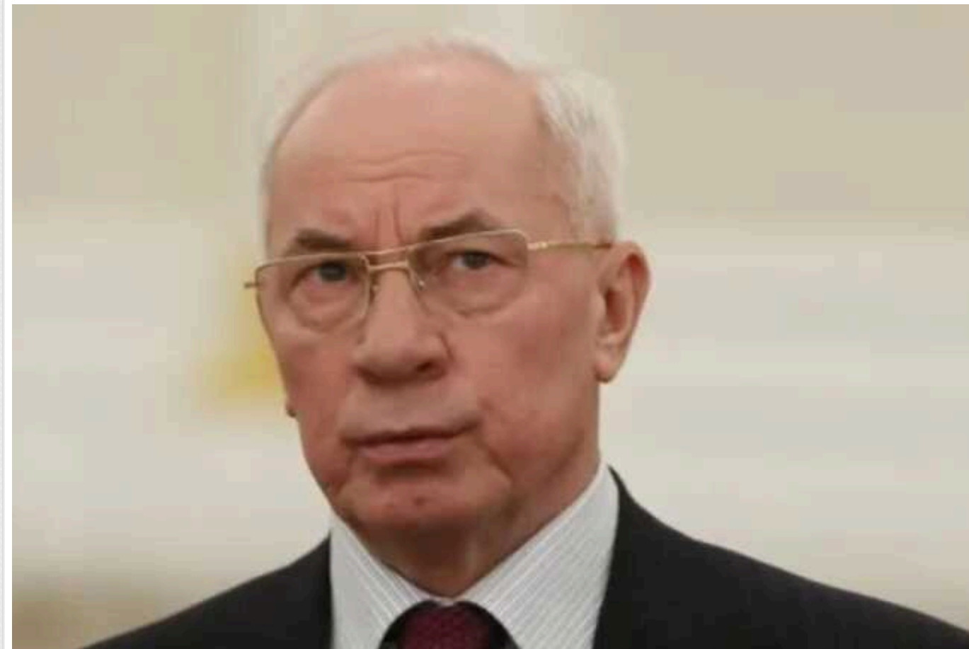
Експрем'єр-утікач Азаров іронічно "привітав" Зеленського з днем народження: українці в Мережі відреагували

Колишній прем'єр-міністр часів Януковича Микола Азаров, який переховується від українських правоохоронних органів у Росії, іронічно привітав президента України Володимира Зеленського з днем народження. Реакція читачів навряд чи була такою, на яку він очікував.