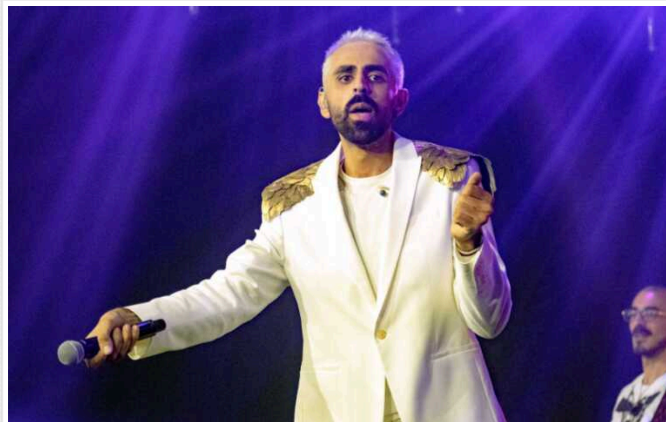
Країна-аутсайдерка вийшла на друге місце в рейтингу букмекерів Євробачення, наздоганяючи Україну

У рейтингу букмекерів конкурсу Євробачення-2024 вперше за довгий час сталися відчутні зміни. Країна-аутсайдерка Ісландія, яка раніше балансувала десь на межі 20-го місця, різко піднялася на другу позицію.