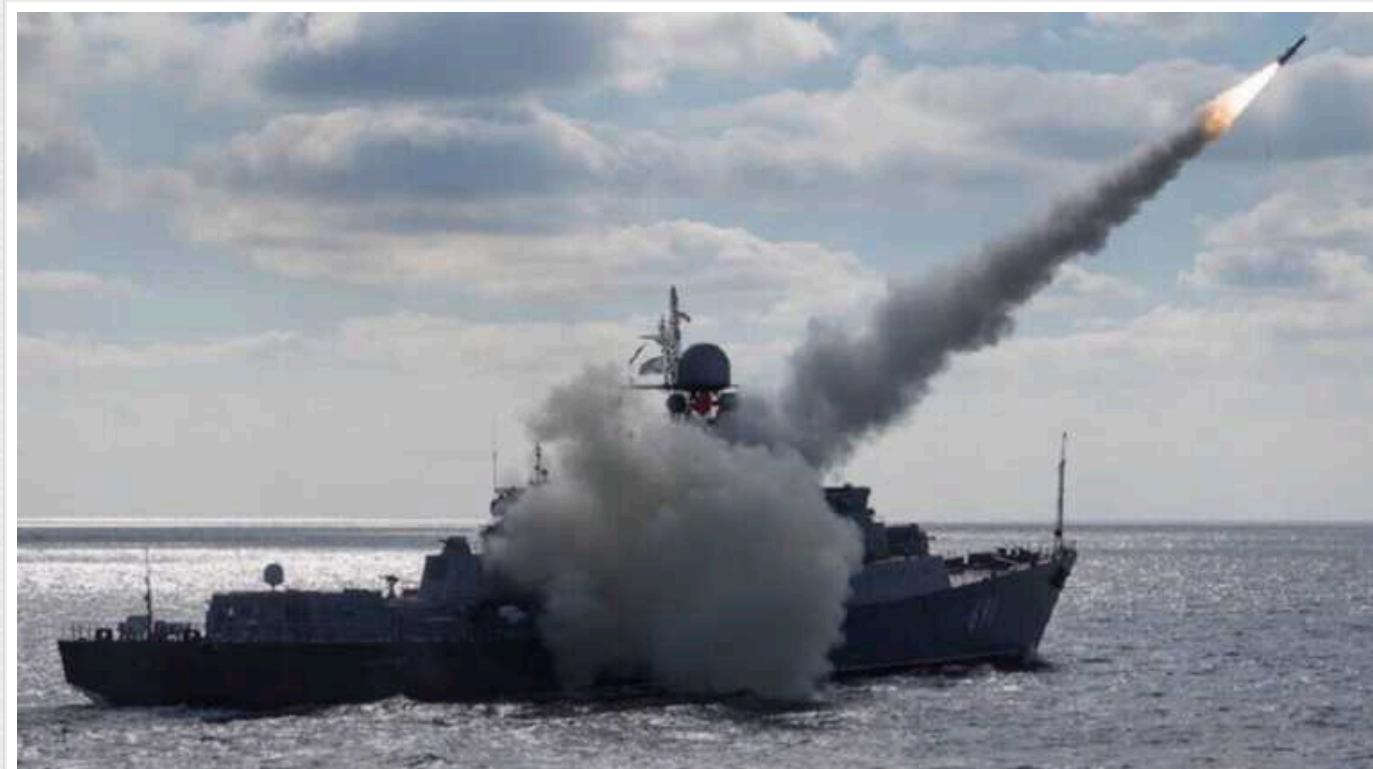
Росія тримає у Чорному морі кораблі з сумарним залпом 16 "Калібрів"

У Чорному морі активність російських ракетносіїв залишається високою. Також не виключено їх використання під час майбутнього удару по Україні.