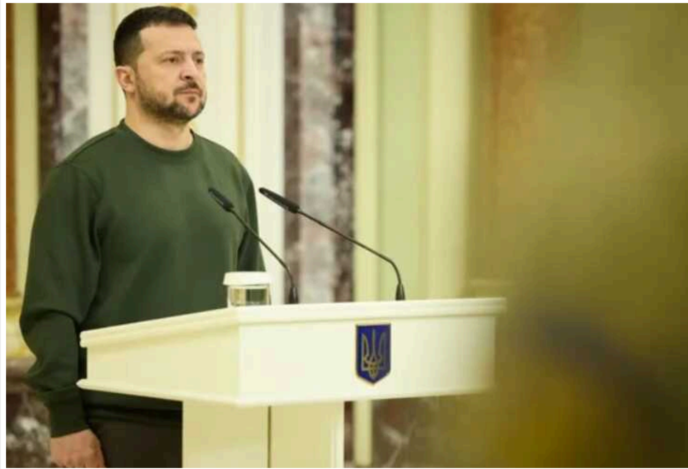
Зеленський загадково відзначив воїнів Нацгвардії України: "Дякую за влучність"

Президент України Володимир Зеленський привітав воїнів Нацгвардії. Особливо він відзначив їхню влучність та ефективність.