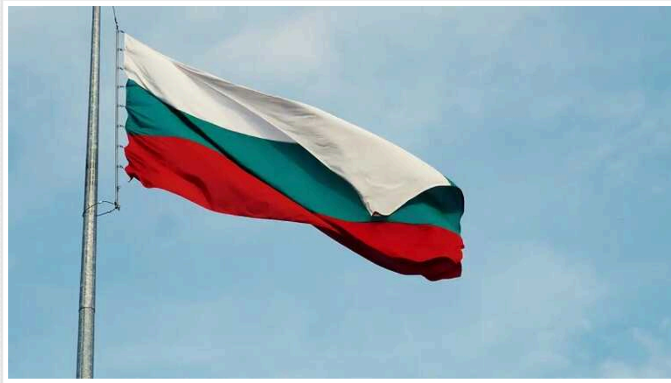
Болгарія продовжила дію тимчасового захисту для біженців з України до березня 2025 року

Уряд Болгарії продовжив до 4 березня 2025 року дію тимчасового захисту для українців, які рятуються від війни.