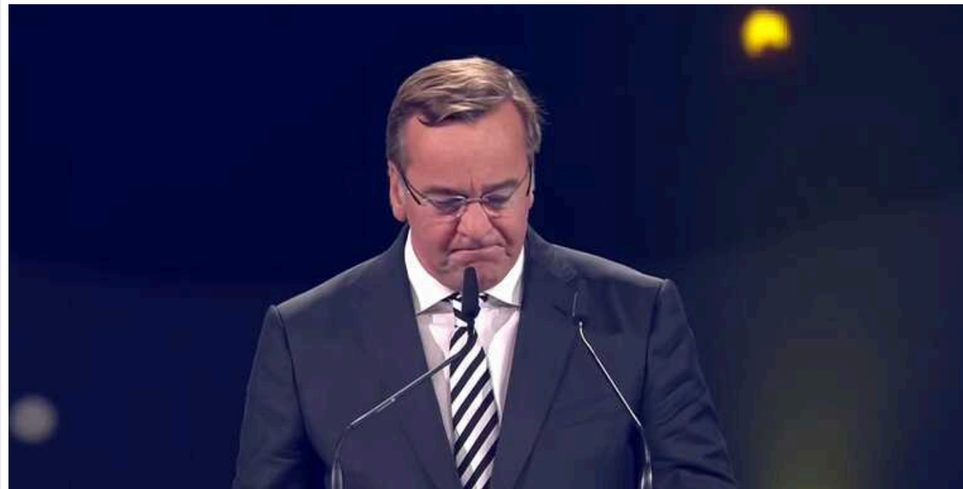
Міністр оборони Німеччини про ситуацію на фронті: "Фактично ситуація зайшла в глухий кут"

Міністр оборони ФРН Борис Пісторіус вважає ситуацію на фронті в Україні тупиковою, а главу МЗС України Дмитра Кулебу назвав "схильним до ескалації".