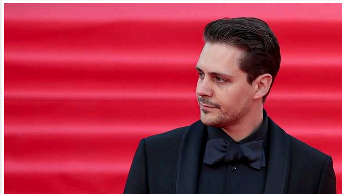
МЗС України розкритикувало співпрацю НВО з актором-прихильником війни Мілошем Біковичем

МЗС України розкритикувало американський телеканал НВО за рішення залучити до зйомок третього сезону популярного серіалу "Білий лотос" російського актора Мілоша Біковича. Бікович родом із Сербії та отримав російське громадянство.