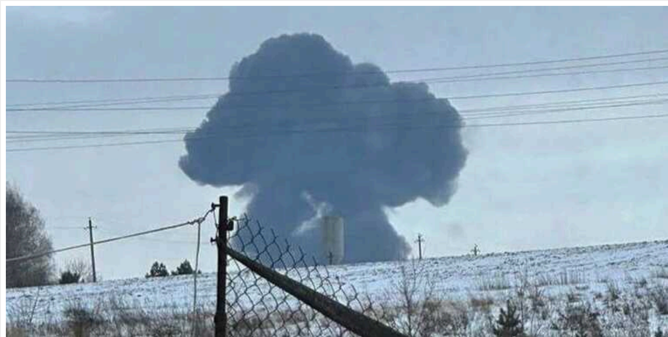
Падіння Іл-76: Омбудсмен викрив росіян у брехні зі "списками" полонених

Деяких українських військовополонених із заявленого російськими пропагандистами списку осіб, які нібито перебували на борту літака Іл-76, що розбився в Білгородській області, вже обмінювали.