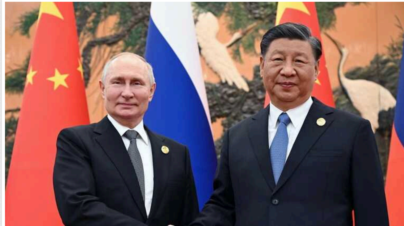
КНР та РФ запустили супутники, які можуть використати для атаки на об'єкти США

Китай та Росія запустили супутники, призначені для перевірки та ремонту інших космічних кораблів, але можуть бути використані для нападу на об'єкти США.