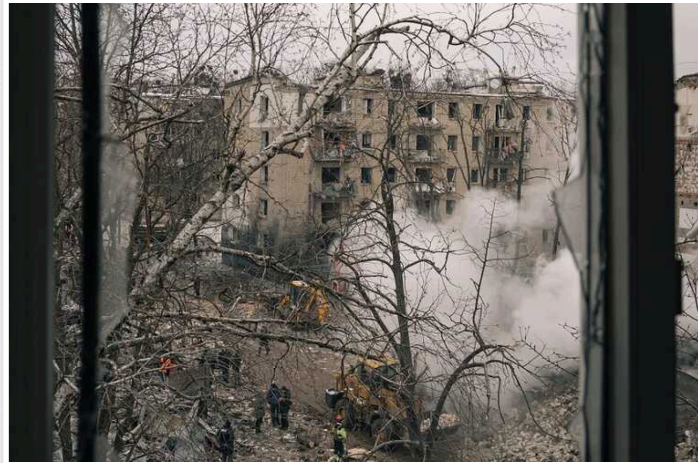
Харків – це «ідеальна ціль» для масового ракетного обстрілу окупантів, – Washington Post

Видання пише, що через близьку відстань до кордону, навіть американські Patriot, які зараз стоять у Києві, не допоможуть збивати балістику.