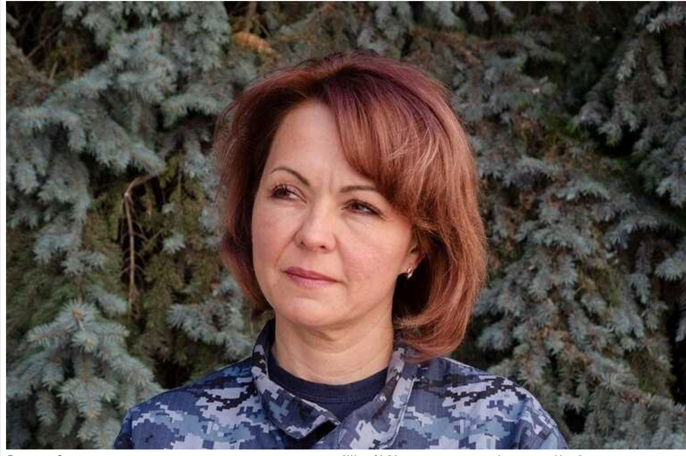
Гуменюк: Окупанти знову шукають нову тактику застосування "Шахедів" і планують потужні атаки на Україну

Увечері 24 січня під час атаки ударними дронами-камікадзе на Одещині російські окупанти застосовували складне маневрування БПЛА. Зокрема, під час цієї атаки дрони летіли один за одним, не даючи можливості та часу силам ППО зорієнтуватися.