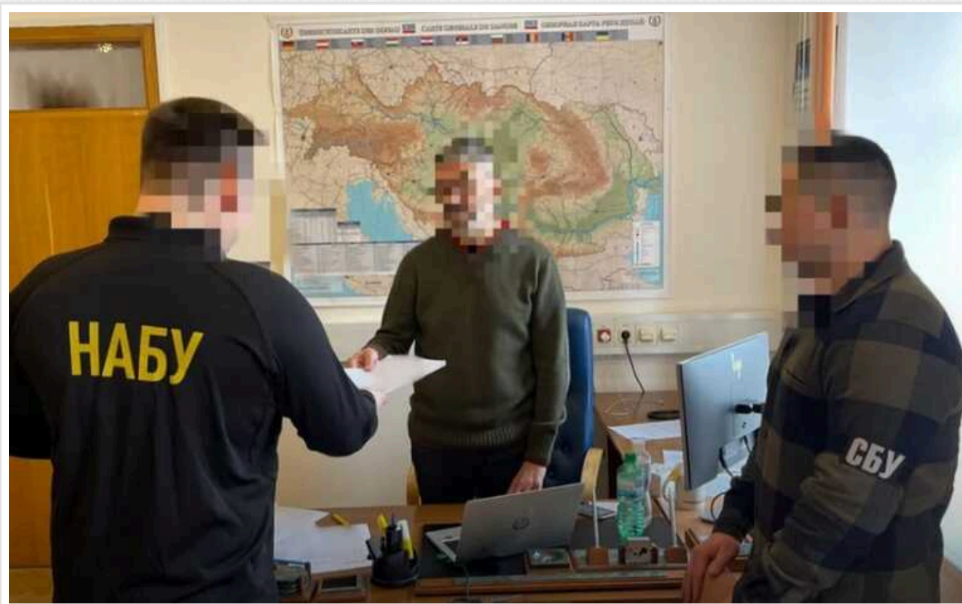
НАБУ і САП спільно з СБУ повідомили про підозру шістьом учасникам організованої злочинної групи: заволоділи 32 суднами ПрАТ «Українське Дунайське пароплавання» та переробили їх на 12 барж

У четвер, 25 січня, Національне антикорупційне бюро і Спеціалізована антикорупційна прокуратура спільно зі Службою безпеки повідомили про підозру шістьом учасникам організованої злочинної групи, яка заволоділа майном ПрАТ «Українське Дунайське пароплавання» на суму понад 80 млн грн. Про це повідомляють пресслужби антикорупційних органів.