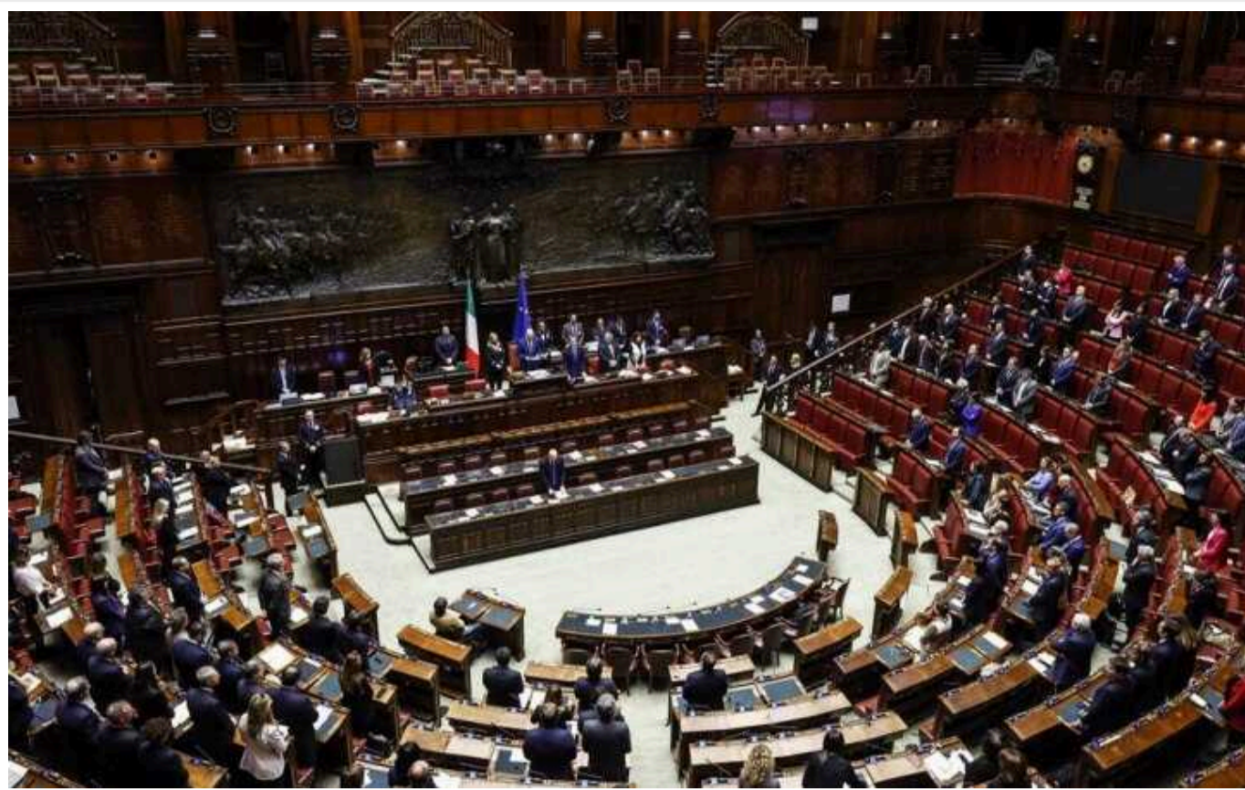
Сенат Італії дав зелене світло на постачання зброї Україні до кінця року: Джорджія Мелоні була непохитною у своїй рішучості допомогти Україні

Сенат Італії дав зелене світло рішенню уряду про продовження дозволу на постачання зброї Україні до кінця 2024 року. Указ прийнято переважною більшістю голосів.