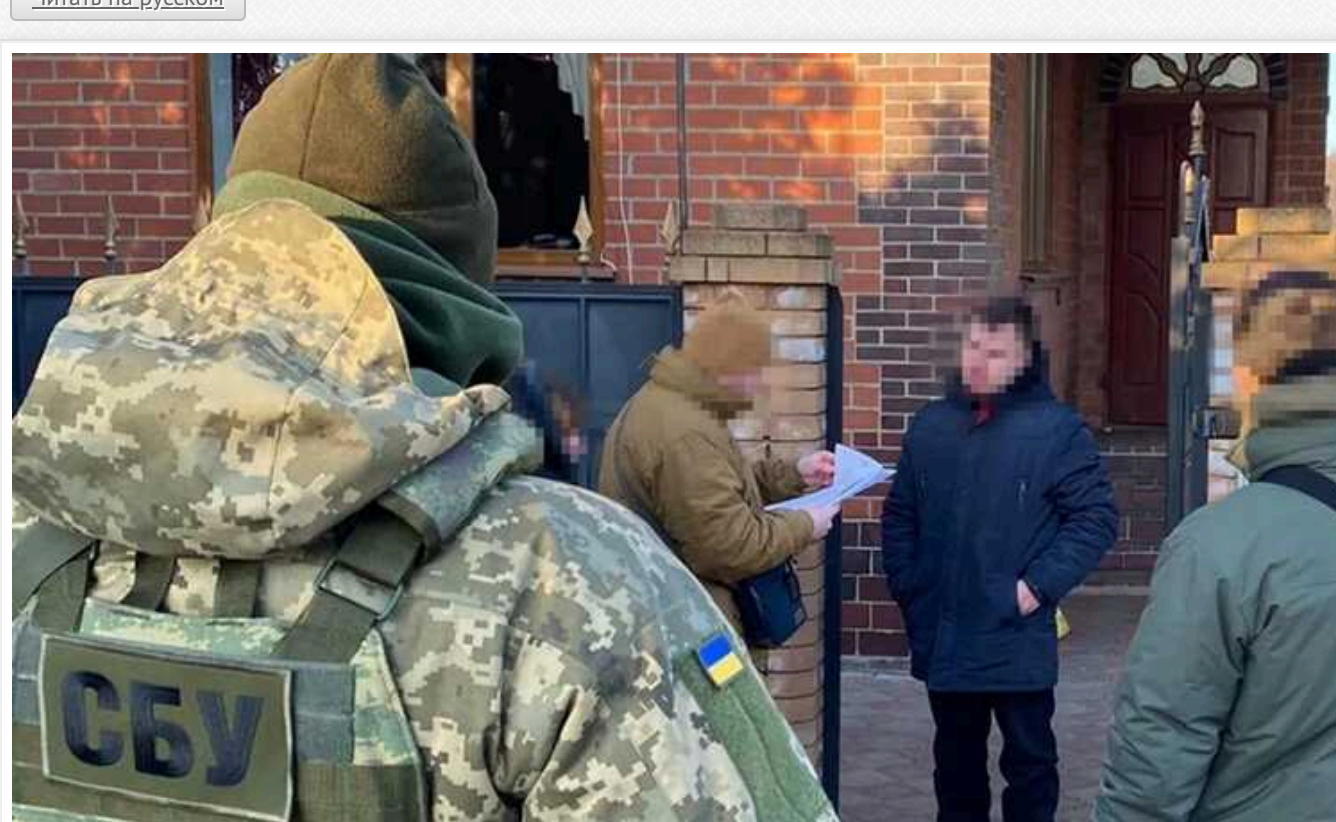
Російські інформатори отримали тюремні строки: коригували обстріли електропідстанцій на сході України

Російських інформаторів, які коригували обстріли окупантів по електропідстанціях у Харкові та Слов'янську, було засуджено до 10 і 8 років за грабми. З їхньою допомогою окупанти здійснили ракетно-артилерійські атаки на соціальні та енергетичні об'єкти у прифронтових регіонах.