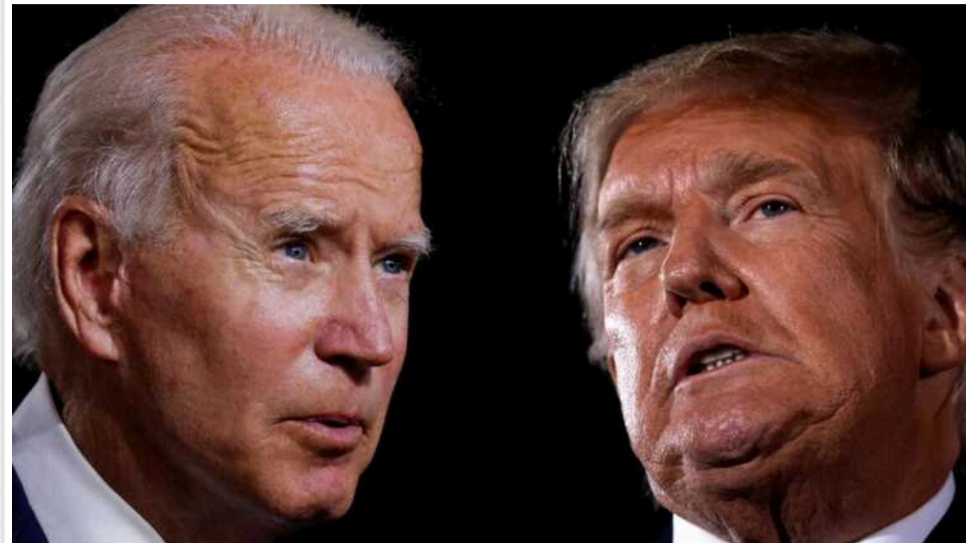
Нове опитування Reuters/Ipsos: 40% у Трампа проти 36% у Байдена

Виходячи з нового опитування Reuters/Ipsos, стало відомо, що Трамп вже випереджає Байдена з перевагою 40% проти 36%.