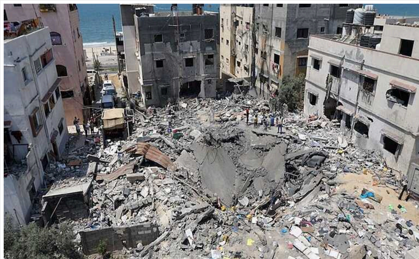
МЗС Фінляндії закликає Ізраїль до негайного гуманітарного припинення вогню у Газі

"Час самооборони минув. Я говорю цілком ясно: досить, громадянське населення Гази потребує негайного гуманітарного припинення вогню. Люди голодують і не мають чистої питної води – і виною цьому насамперед Ізраїль. Ізраїль має відкрити більше прикордонних переходів, щоб забезпечити доставку гуманітарної допомоги у секторі Газа", - заявила міністр закордонних справ Фінляндії Еліна Валтонен в інтерв'ю RND.