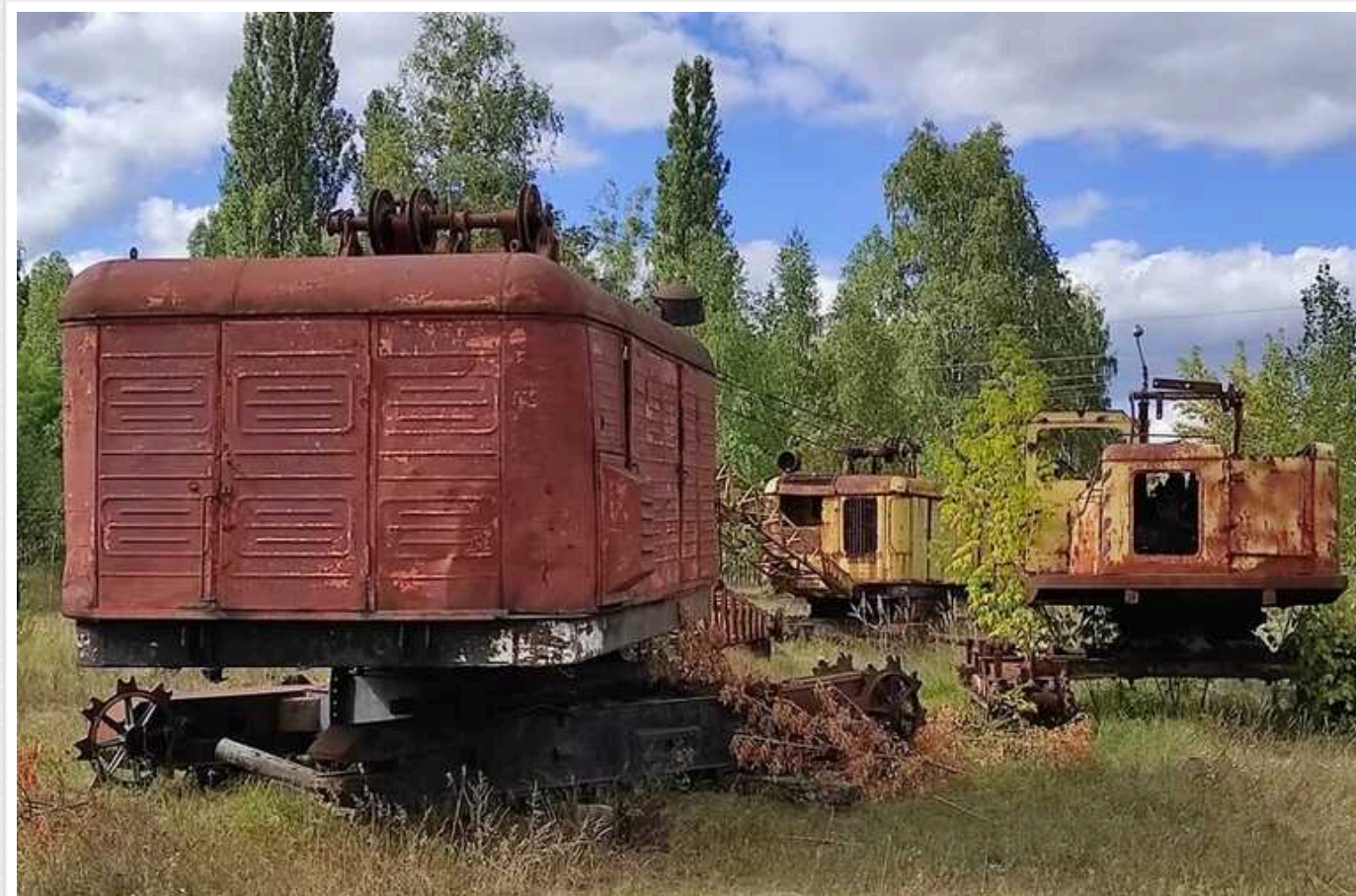
За півціни, без торгу і конкурентів: хто викупив майно ДП "Житомирторф"?

Регіональне відділення Фонду державного майна України по Рівненській та Житомирській областях у понеділок, 22.01.2024 уклало договір купівлі-продажу єдиного майнового комплексу ДП «Житомирторф» за результатами приватизаційного аукціону, запланованого на 20.12.2023 (це була восьма спроба продати ЄМК Житомирторфу).