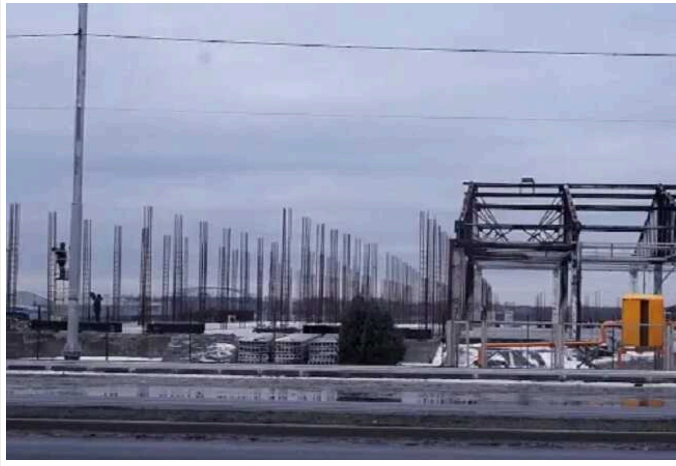
У Мережі показали, який вигляд мають ринок "Азовський" і вулиця Купріна в окупованому Маріуполі

Російські загарбники продовжують свою руйнівну діяльність у тимчасово окупованому Маріуполі, перетворюючи його на гетто та ведучи місто до неймовірної катастрофи. Вулиці колишнього квітучого міста зараз переповнені кучами сміття та нагадують справжні моголиники, які відображають всю суть Росії.