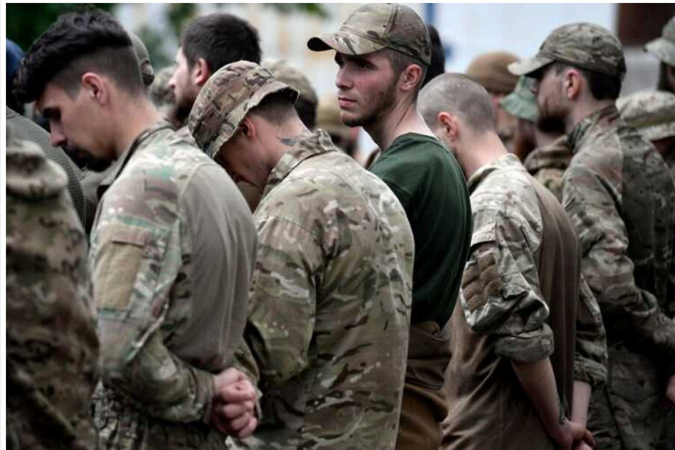
В РФ заявили, що обміни полоненими з Україною продовжаться: "Будемо розмовляти хоч із чортом"

У Держдумі наголосили, що у країні-агресора "немає іншого виходу" і вони будуть "розмовляти з урахуванням усіх реалій, всіх подій" та розумінням того, з ким "мають справу".