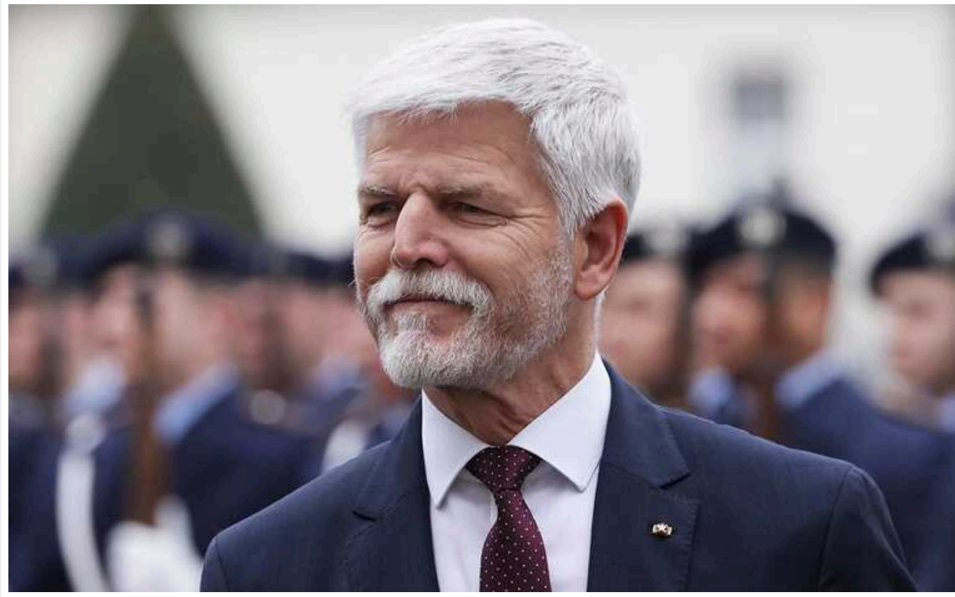
РФ перед виборами посилить тиск на фронті, її не варто недооцінювати, – Петр Павел

Президент Чехії Петр Павел заявив, що припинення допомоги Україні не зупинить розпочату Росією війну, тому союзники мають допомогти Києву досягти "найкращого можливого результату". На його думку, країну-агресор Росію не потрібно недооцінювати, адже вона не є слабким супротивником, і на війну треба дивитися реалістично.